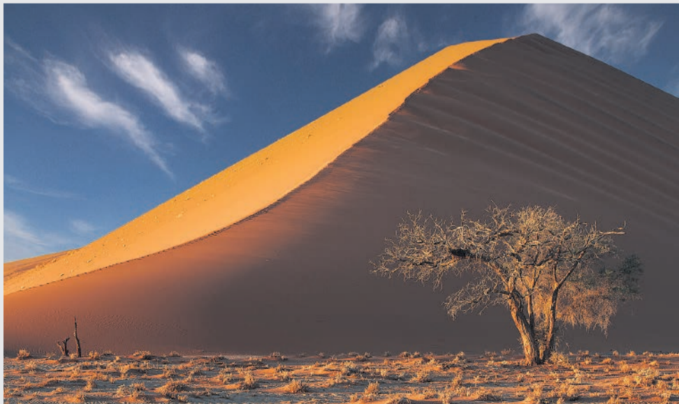
Francois Roux se "Namib duin".