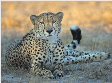
Mietsie Visser (senior-fotograaf) se "Cheetah with flies".