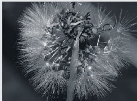
Pikkie Marais se "Staan vas in die koue".