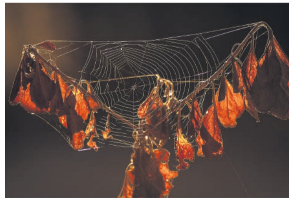
Haig Fourie se "Goue spinnerak".