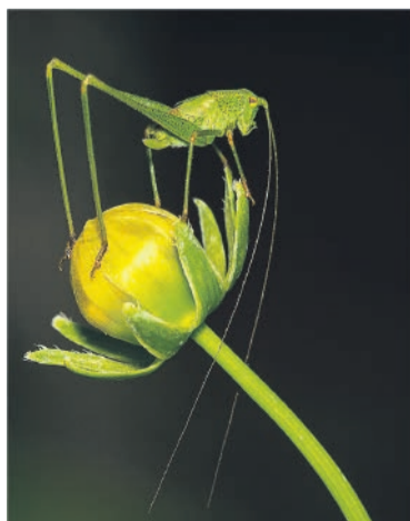
Haig Fourie se wenfoto "Posing Katydid Nymph".